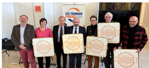
Assemblée Générale de l'ADM76 à Rouen, le 2 décembre 2023