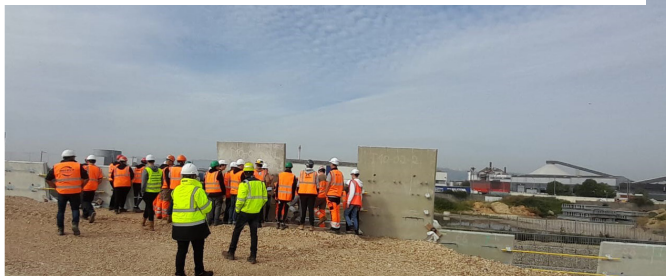
Rouen (76) – Raccordement du Pont Flaubert à la Sud III, Bouygues TP