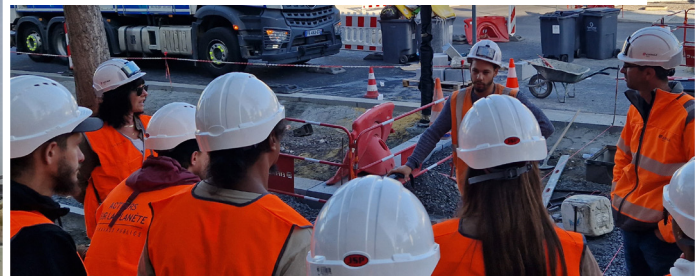
Caen (14) – Aménagement de la rue d'Auge, Eiffage Routes