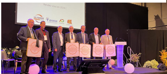
Assemblée Générale de l'AMM à Saint-Lô, le 20 octobre 2023