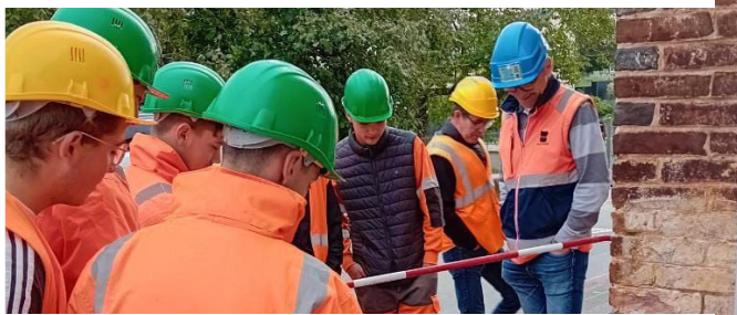
Champfleur (72) – Adduction d'eau potable, Bernasconi