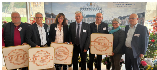
Assemblée Générale de l'AMO au Haras du Pin, le 19 octobre 2023