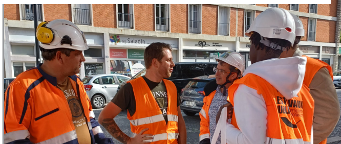
Le Havre (76) – Requalification des Boulevards Winston Churchill, Eurovia