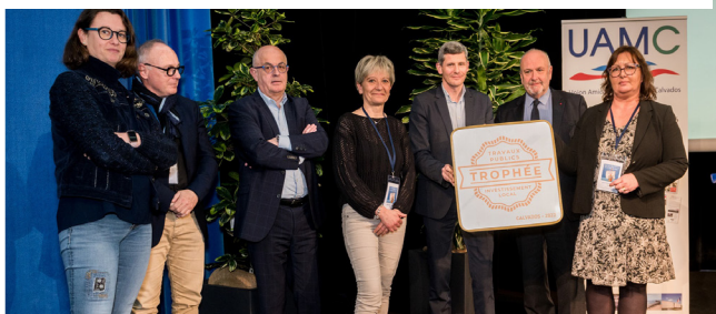
Assemblée Générale de l'UAMC à Caen, le 3 avril 2023